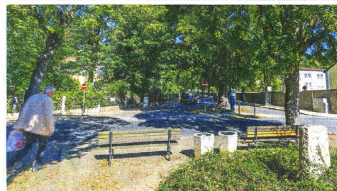
Schöne Aussicht. Der Eduard-Bilz-Platz soll nächstes Jahr umgebaut werden. Statt des Bilz-Gedenksteins (re. im kl. Bild) wird dann eine Nymphe (gr. Bild) an den bekannten Radebeuler erinnern, der auch als Vater der volkstümlichen Naturheilkunde bezeichnet wird.

1 000 Euro plant die Stadt an jährlichen Unterhaltungskosten, beispielsweise für das Wasser im Becken vor der Nymphe. Die Wartung der Figur dürfte keine Sorgen machen, sagt der Künstler. An den senkrechten Flächen sollten sich weder Staub noch Laub ablagern. Ein möglicher Algenbelag auf der Westseite lasse sich von den glatten Flächen des Kunstwerks leicht entfernen.